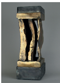
djortsch / Jürg Eberhard