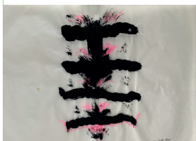
Eliza Thoenen Steinle